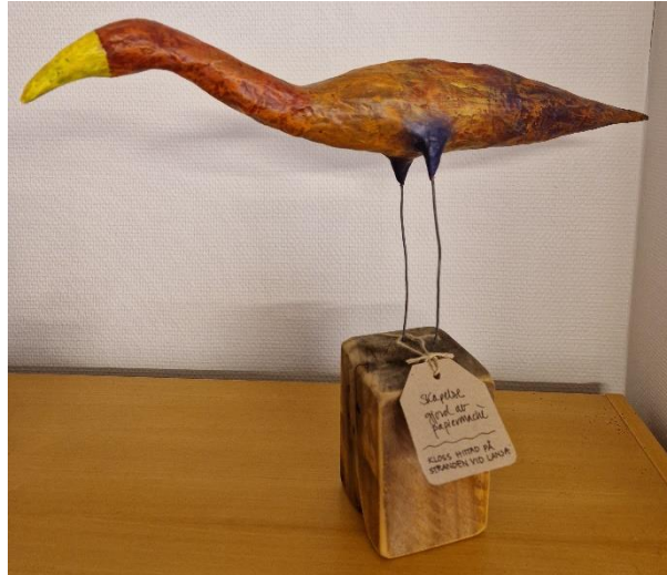
5. Inga-Lill Fredley. Konstverk fågel, papier-maché + trä från Lanså strand, 45x35 cm