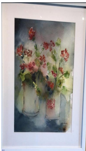
2. Eva Husell. "Pelargon", akvarell, 42,5 x 52 cm