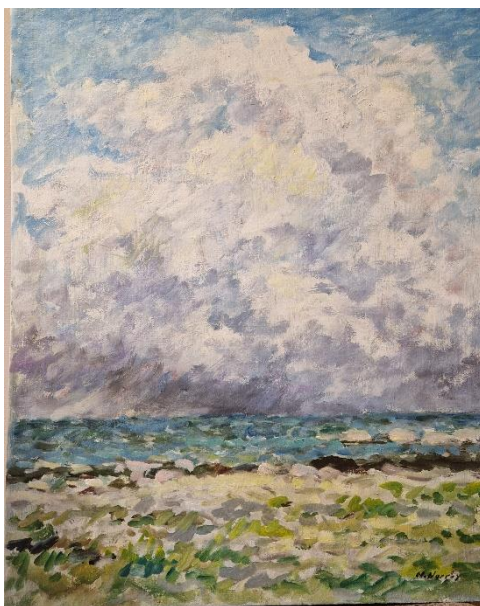
9. Harald Norrby, olja. 43,5x54 cm