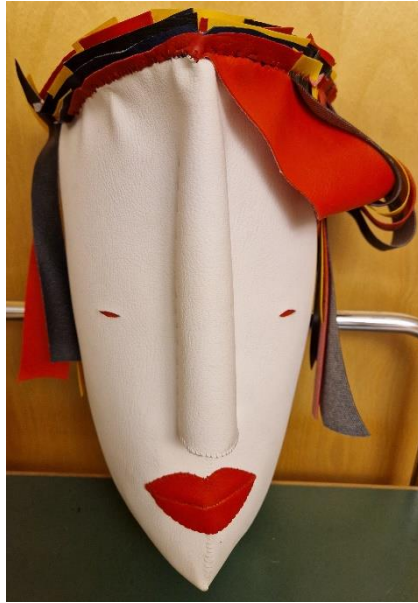
15. Gun Rodenius, "Röd mun", läderimitation, 36x22x16 cm