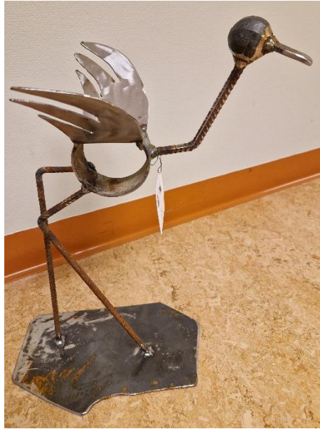
7. Stefan Skimutis, fågel, metallsmide, höjd 50 cm, bredd 35 cm