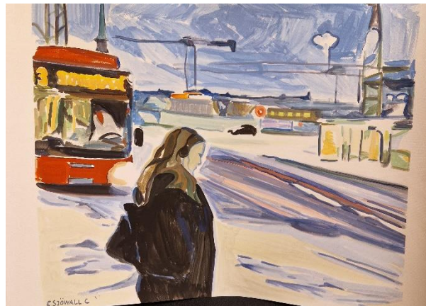
20. Eric Sjöwall Carldéhn, 76 x 56 cm