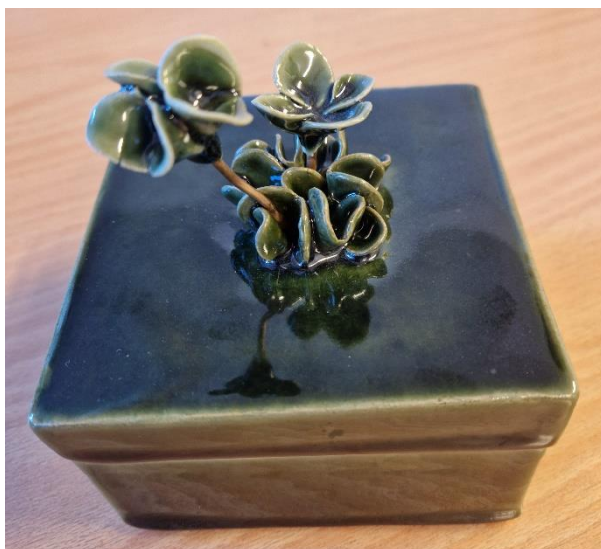
4. Eva Göthberg. Skrin, keramik, 10x10 cm, höjd 8,5 cm