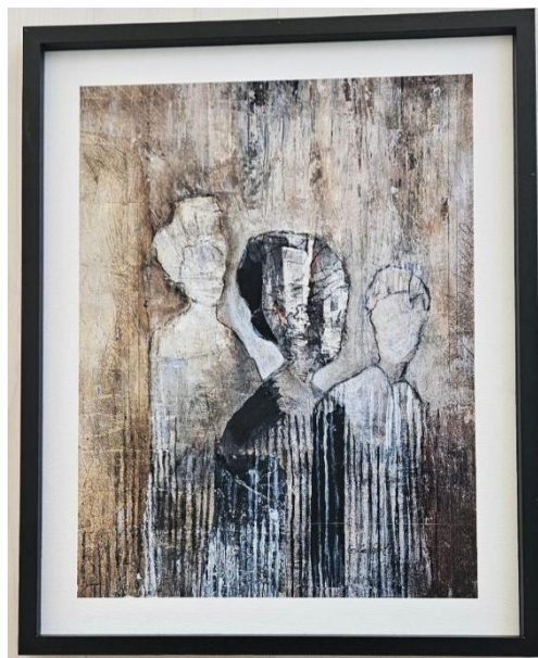
14. Carina Ihd, "Systemskap", ArtFineTryck, 40x50 cm