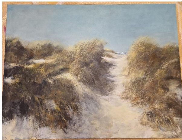
12. Dan Leonette. Olja. 90 x 69 cm.