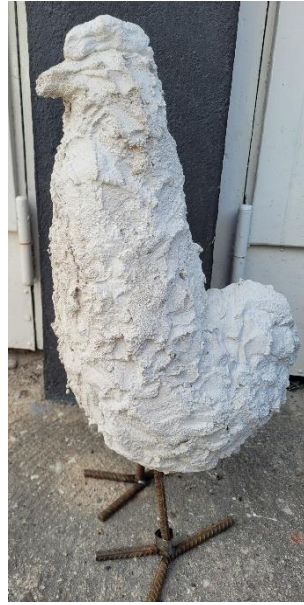
13. Ulla Ahlby. Höna. Betong. 60 cm hög