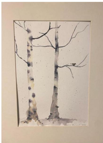
3. Catja Barck. "Björkar", akvarell, oinramad, 30x40 cm