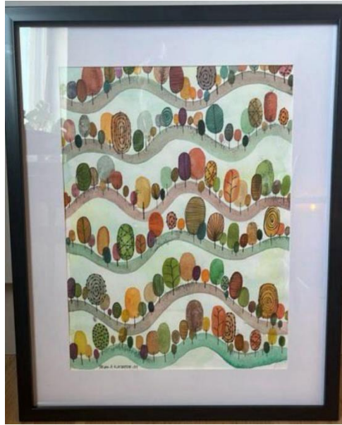
17. Frida Klasdotter, "Skogen", 30x42 cm