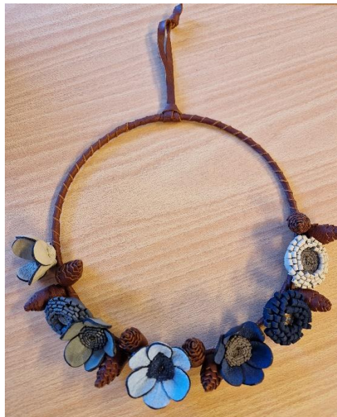
6. Amalia Ericsson. Dörrkrans, skinn, diameter 20 cm