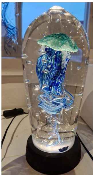
1. Stockholms glasbruk, Manet, 24 cm