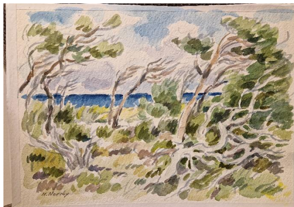
8. Harald Norrby. Akvarell, oinramad, 24x35 cm