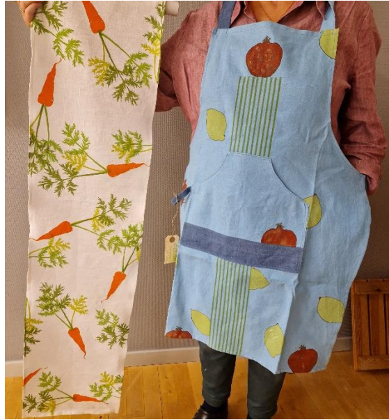
19. Jane Odell, förkläde och löpare 30,5 x 150 cm, linne