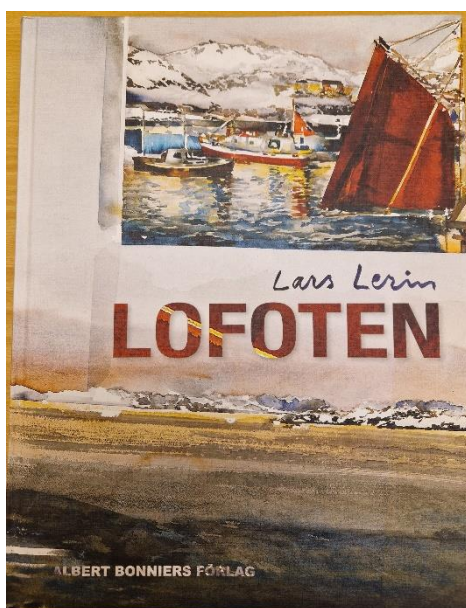
10. Lars Lerin. Konstbok